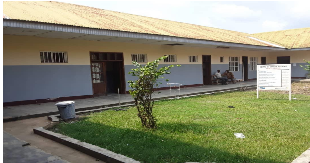
Centre de Santé de Référence Prince Alwaleed