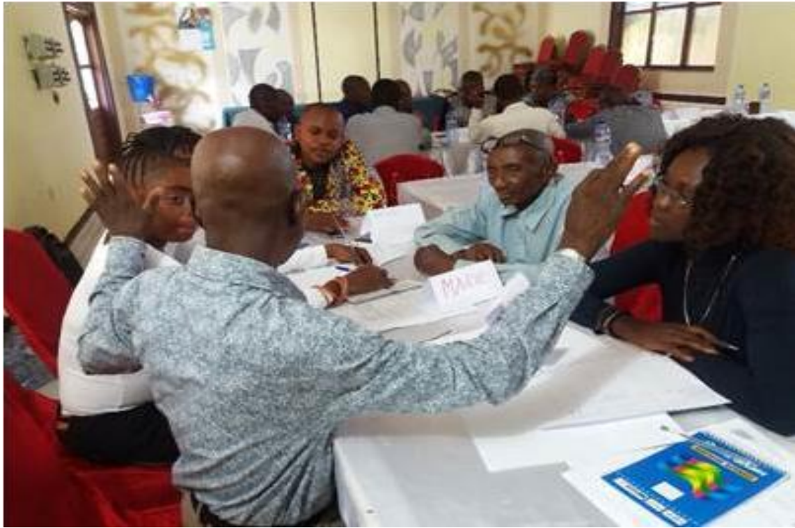
Noyaux d'alerte et Relais communautaires