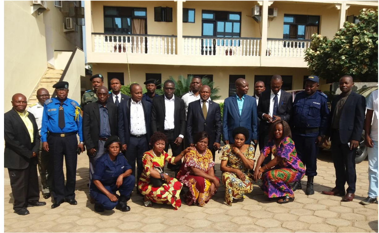
Acteurs de police, justice, santé, société civile